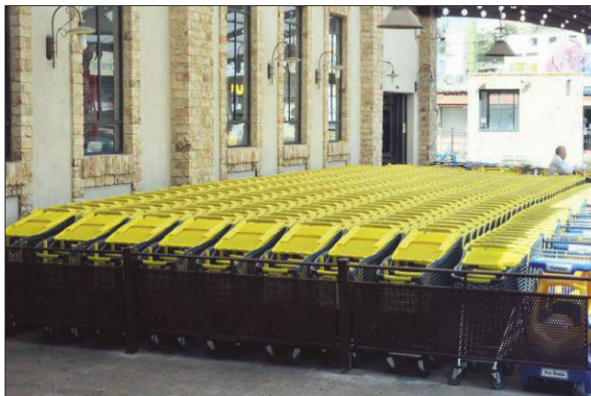
הקפדה על הפרטים ניכרת גם בעגלות הקניות

לאחר הגשמת החלומות המקצועיים, נשאר לסמיר, שלמד שיווק פיננסי בלונדון עוד הלום אחד קטן להגשים – "הייתי רוצה לפתוח בארץ בית ספר מקצועי ללימודי קמעונאות ותודעת שירות. ללמד אנשים בארץ איך להתייחס ללקוח ואיך להעניק את השירות הטוב ביותר שאפשר לתת".