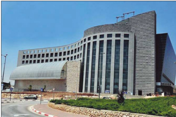
53 אלף מ"ר מרכז המזון בנצרת עילית.

קנייה כוללת, המעניקה שלל מוצרים המשלימים ומשתלבים זה בזה. כך, ניתן למצוא באגף היין פתתנים, חולצי פקקים וסכיני גבינות. לצד מוצרי הבשר מוצעים אביזרי מנגל כמו רשתות, מלקחיים, פחמים וגפרורים. הכל מחושב עד הפרט הקטן ביותר, לנחות ורווחת הלקוח. לפי ערך הכבוד והשוויון מתייחס במרכז המזון באופן שווה לבני כל המגזרים ומציינים