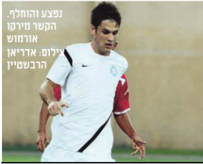
נפצע והחליף הקשר חזיקו אורמוש